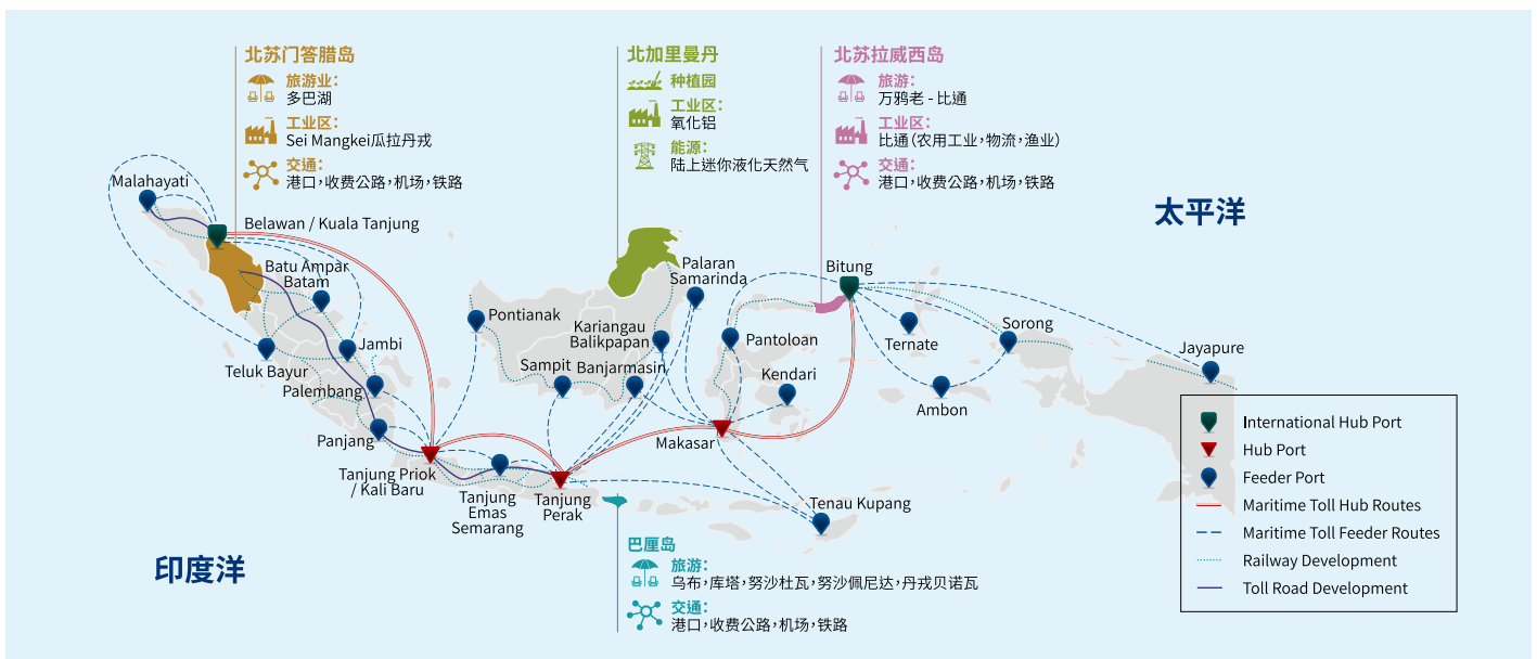
图一：未来一带一路建设已确定4个省份的优先发展方向

印度尼西亚政府也开始进行相当大的体制改革。海事协调部的成立是为了监督全球海上支点计划(GMF)的实施，并领导相关双边谈判和项目，与中国国家发展和改革委员会进行内部和外部协调。印尼投资协调委员会(BKPM)新成立的中国办事处，由一名在印尼生活了20多年的中国侨民负责，BKPM向潜在的中国投资者推介印尼，并向现有企业解释所有与投资相关的监管规定。为改善营商环境并加快投资实现的步伐，印尼政府机构实施了多项改革，例如通过咨询越来越多的中国企业升级在线单一提交营业执照申请。